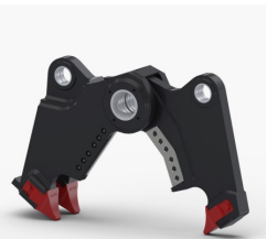
Kit Pince Combi