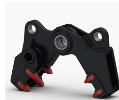
Kit Broyeur (CP)