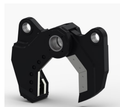
Kit Cisaille (SH)