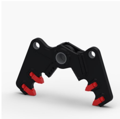
Kit Pince à Béton