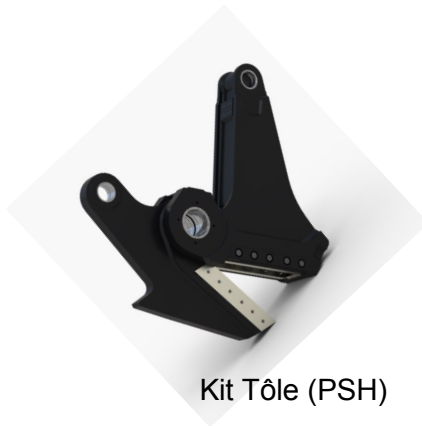
Kit Tôle (PSH)