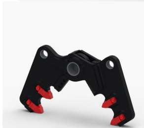
Kit Pince à Béton (CR)