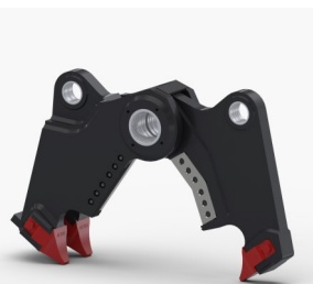
Kit Pince Combi (CC)