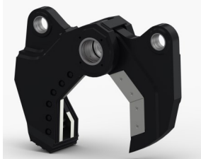
Kit Cisaille (SH)