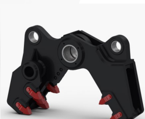
Kit Broyeur (CP)