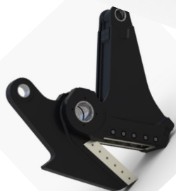
Kit Tôle (PSH)