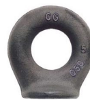
Anneau à souder