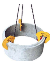
Pince pour buse