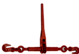
Tendeur à cliquet