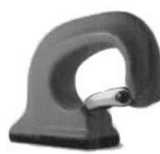
Crochet à souder